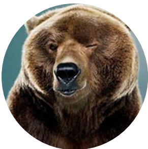
Автор текста: Миша Ковальски , научный обозреватель.

На сайте опубликовано 1654 текстов этого автора.