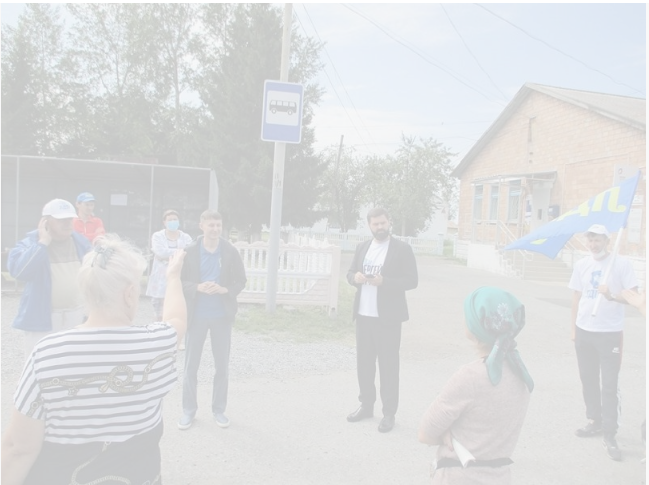
Пятеро смелых: в Ачинске определились кандидаты на довыборы в Заксобрание