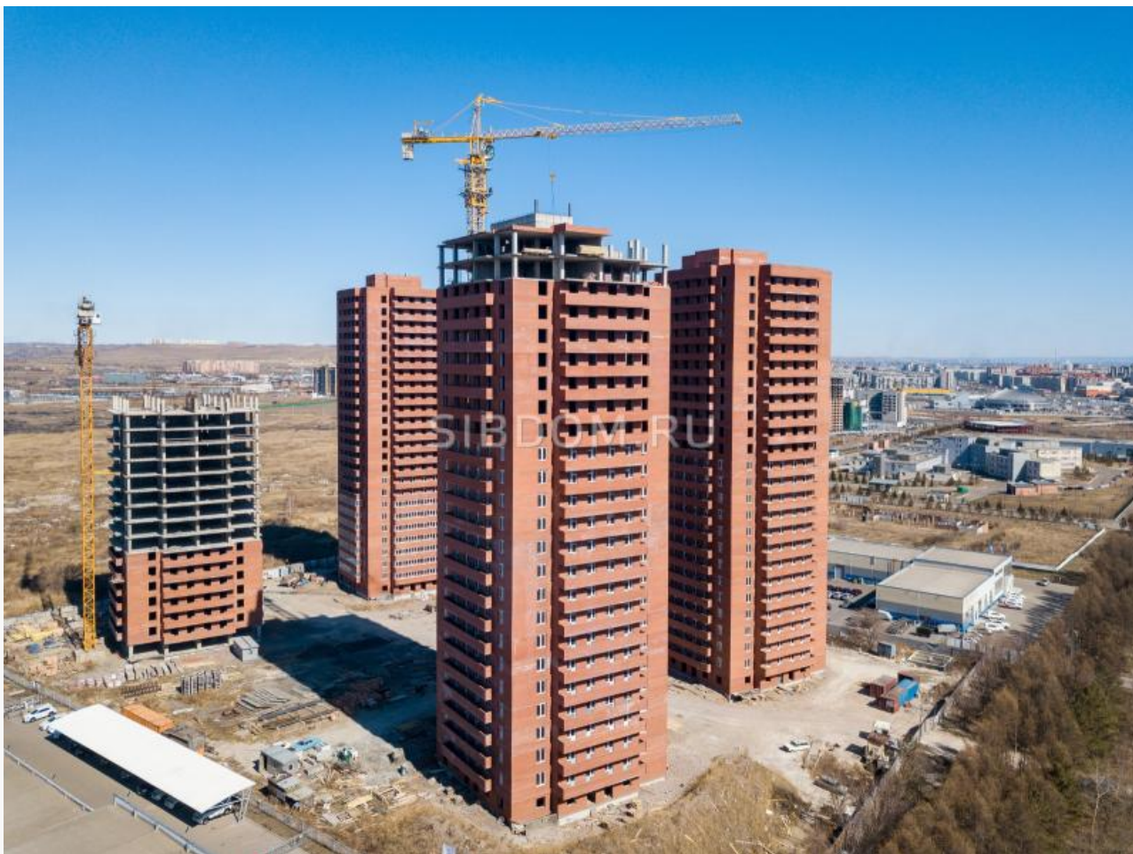
ЖК «Квадро» на ул. Караульной. В мае 2019-го завершение комплекса оценивали в 400 миллионов рублей.

Объекты должны были сдать в эксплуатацию в июне 2018 года, но сделано этого не было. В феврале 2019-го стройкой «Квадро» заинтересовалась прокуратура. Летом 2019 года в офисах компаний «Спецстрой», «Ситистрой», «Сибинвест» и «Строительное управление 208» прошли обыски. Против руководителей четырёх компаний было возбуждено уголовное дело о мошенничестве, суд избрал меру пресечения в виде ограничения свободы.