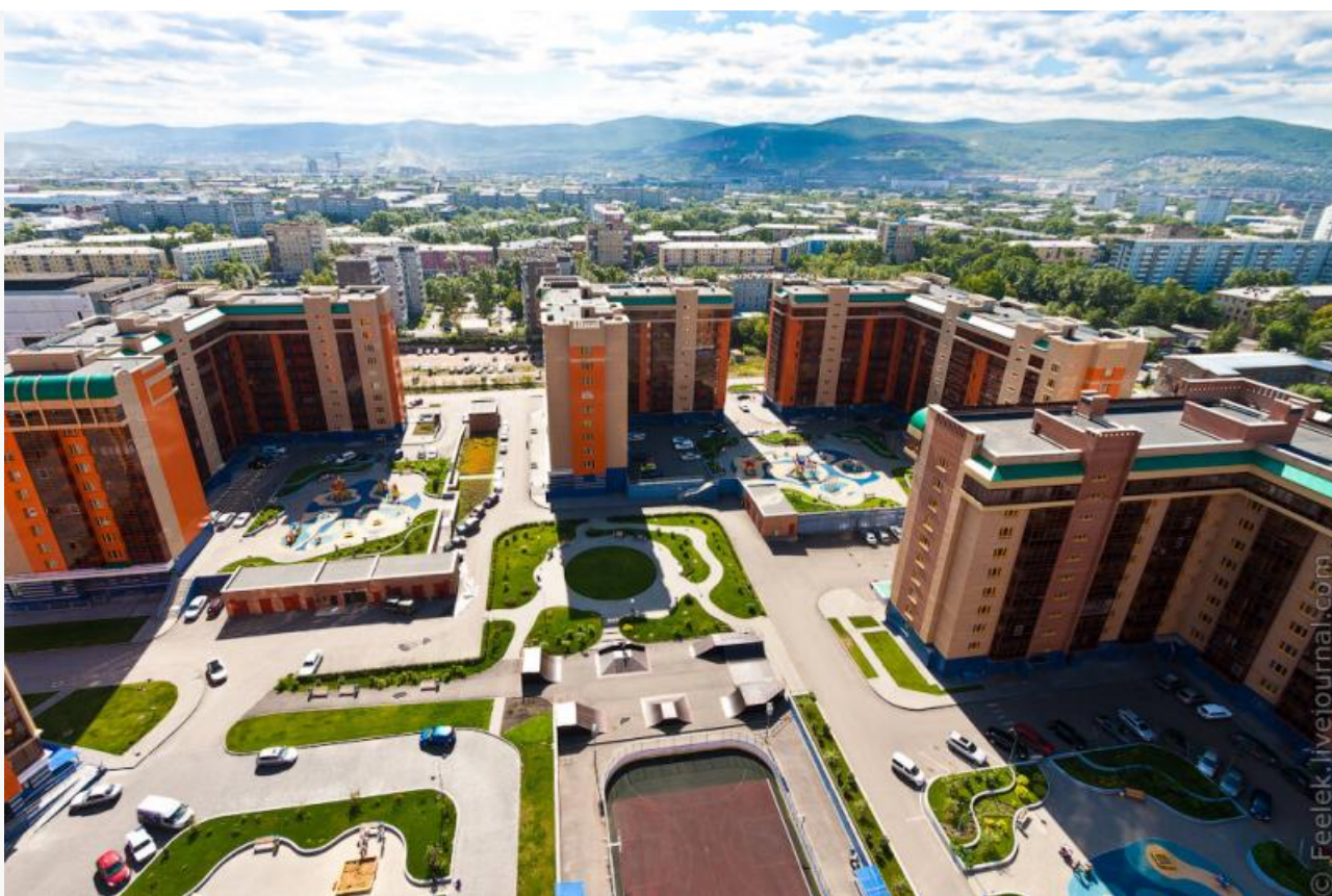
Застройку «Южного берега» группа компаний «СМ.СИТИ» начала в 2007 году.

Так произошло в «Южном берегу». На этапе строительства ГК «СМ.СИТИ» обещала построить школу в самом центре застраиваемого района. Но вместо школы девелопер построил очередной жилой дом. Видимо, так вошёл во вкус получения коммерческой прибыли от реализации квартир, что не смог остановиться.