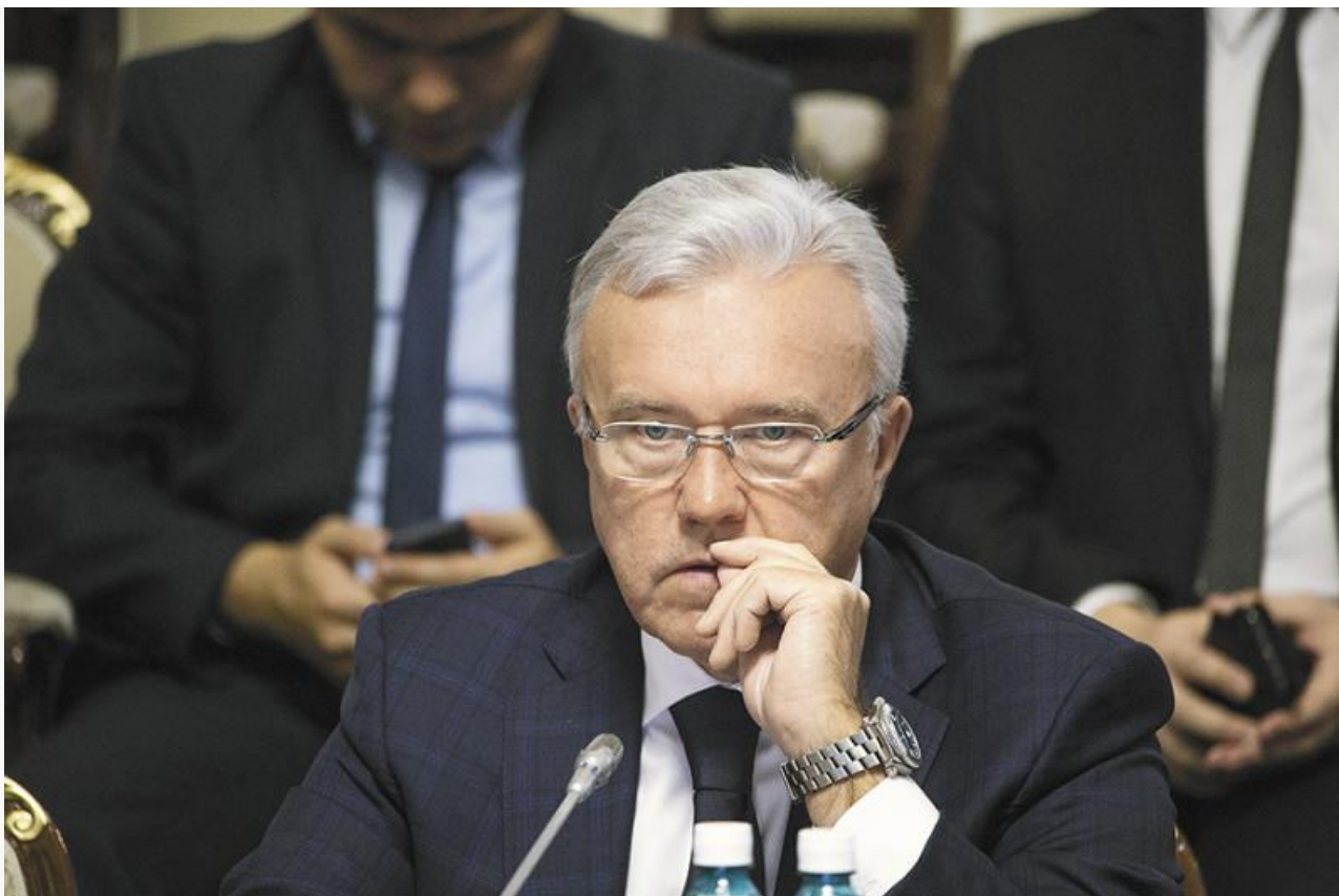
Губернатор Красноярского края

Мы неоднократно писали, что питание школьников неплохая кормушка, ведь с сентября на обеспечение учеников младших классов горячими обедами будут выделяться средства из федерального бюджета. И есть все основания полагать, что этот бизнес хотят передать в частные руки приближённых к администрации. Других объяснений бездействия мэрии мы не видим.