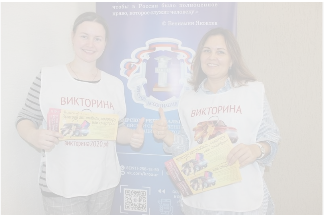
Конституционное лото, или Полный плебисцит