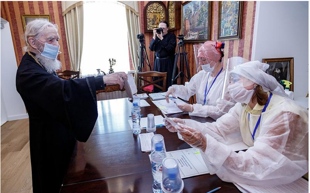
Голосование в Псково-Печерском монастыре