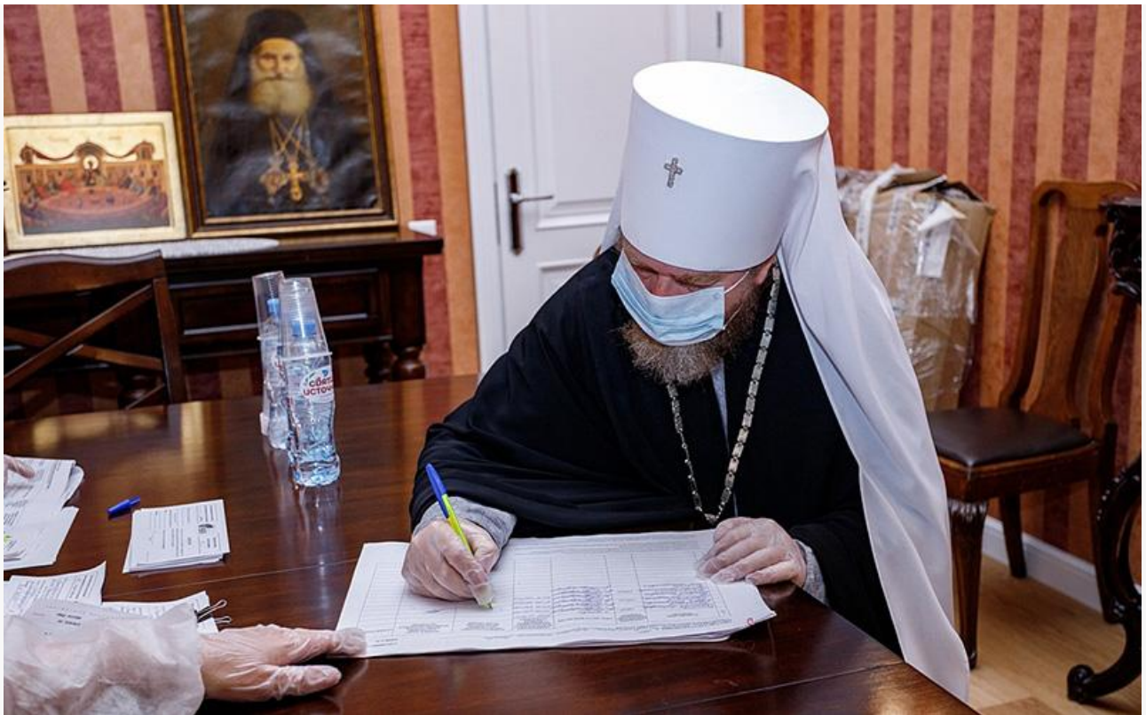
Голосование в Псково-Печерском монастыре. Митрополит Тихон