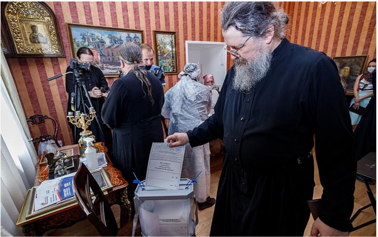
Голосование в Псково-Печерском монастыре