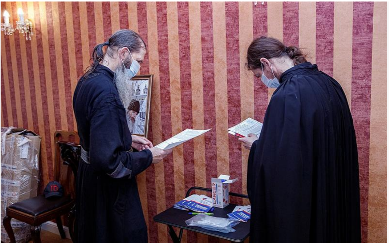
Голосование в Псково-Печерском монастыре