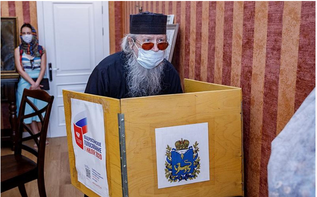
Голосование в Псково-Печерском монастыре