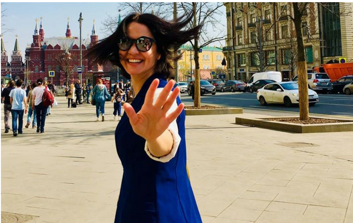
Фото: аккаунт Елены Мироненко в Facebook

Автор: Филипп Марков © Babr24.com КУЛЬТУРА, РОССИЯ, ИРКУТСК, КРАСНОЯРСК 👁 148438 24.06.2020, 18:20 📄 2388