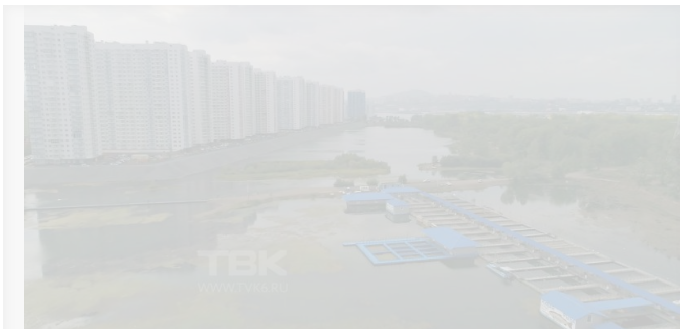
Фото телеканала ТВК, на котором хорошо видно Белые росы и

Как известно, заболачивание и обмельчание протоки — следствие малого водотока: стоячая вода прогревается солнцем, вследствие чего водная флора активно растёт. Малая проточность воды также способствует скапливаю бытового мусора и опасных бактерий, делая это место непригодным для купания.