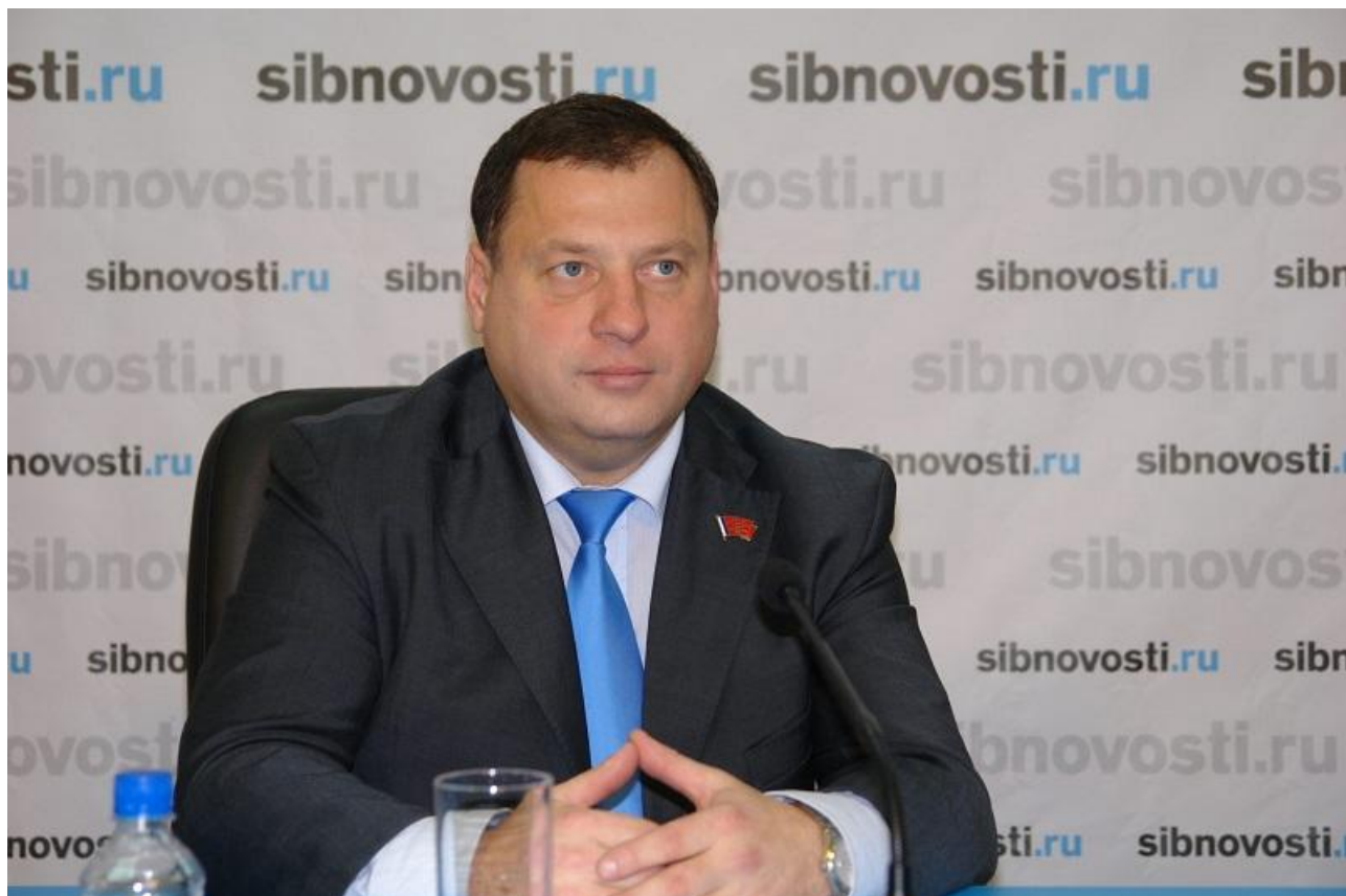
Александр Усс, губернатор Красноярского края:

– Голосование по поправкам в Конституцию, в котором мы все должны принять участие 1 июля, – очень важное для страны событие. Эти изменения в основном законны, правильны и своевременны. Они были инициированы главой государства и помогут обеспечить стабильность политической системы России, усилить ее суверенитет, закрепить социальные гарантии для граждан, совершенствовать законодательный процесс.