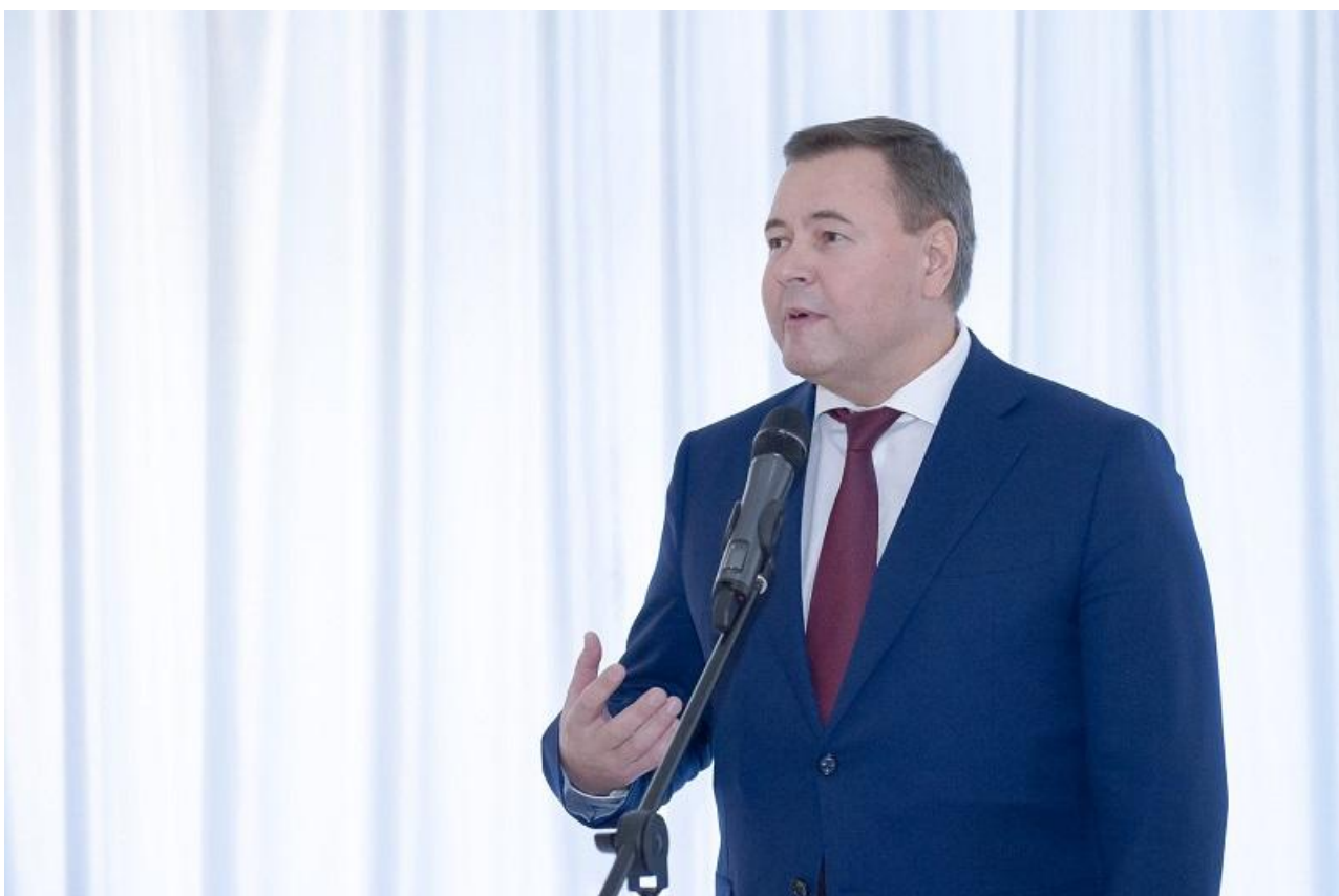
Юрий Швыткин, депутат Госдумы от Красноярского края:

... Нашей стране точно не нужны новые потрясения, и я лично хочу поддержать тот сценарий, по которому Россия получит гарантию своего развития, гарантию стабильности.