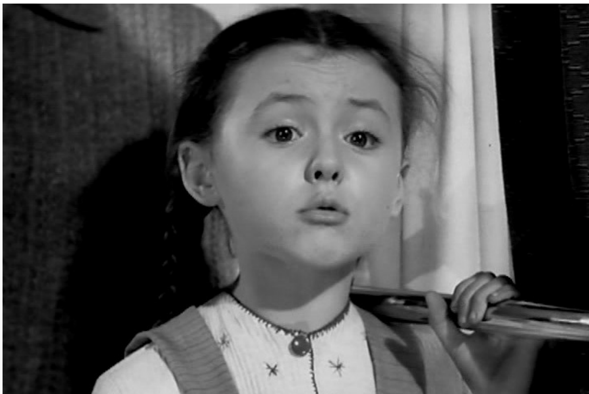
вырабатывает характер», 1953 год