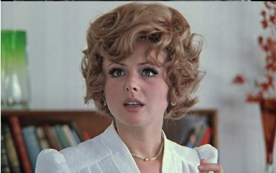
Михайловна Тимофеева в фильме «Иван Васильевич меняет профессию», 1973 год