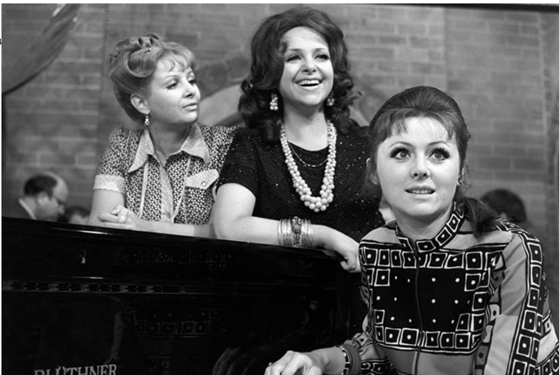
телеспектакле «Кабачок "13 стульев"»

За годы служения сцене Театра сатиры именинницей сыграно множество ярких ролей.