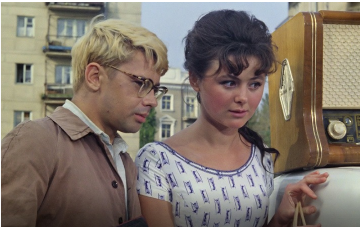
«Операция «Б» и другие приключения Шурика», 1965 год

На сегодняшний день в фильмографии именинницы около 60 фильмов, сериалов и телеспектаклей. Но по большому счёту звёздных киноролей во взрослом возрасте у неё всего три, причём все три в фильмах Леонида Гайдая: уже упомянутая Лида в «Операции «Б», та же, но повзрослевшая Лида в комедии «Иван Васильевич меняет профессию» и супруга певца Барыгина-Амурского Танюша в новелле «Забавное приключение» комедии «Не может быть!».