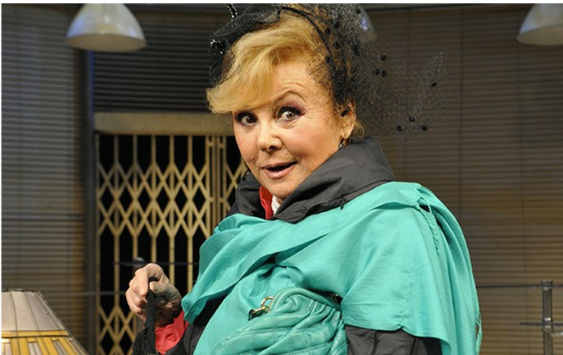
«Идеальное убийство». Театр сатиры, постановка 2009 года