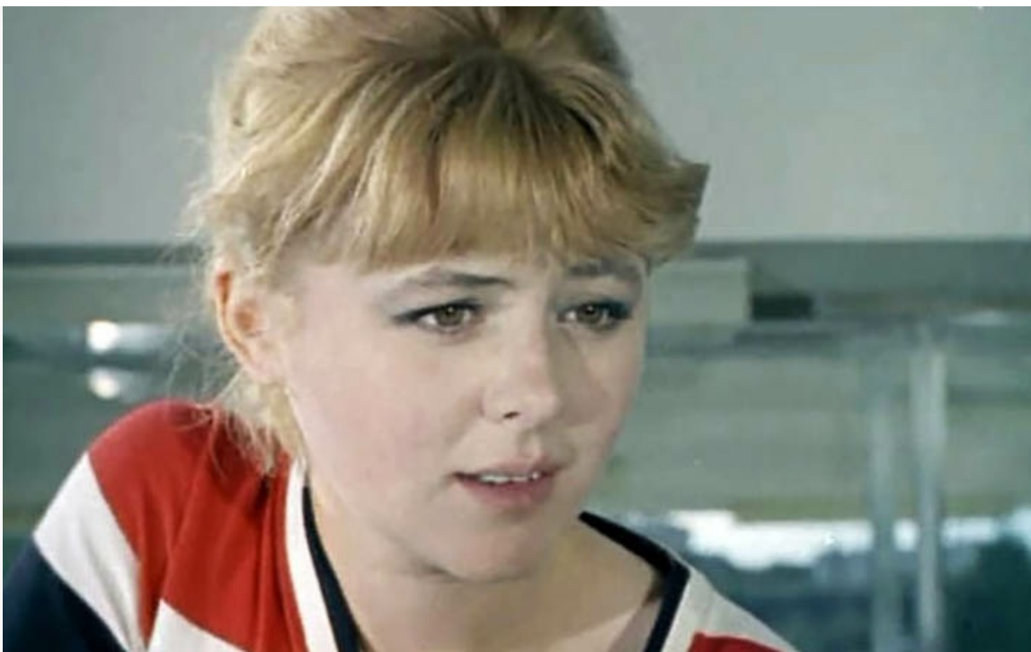
Сашенька», 1966 год