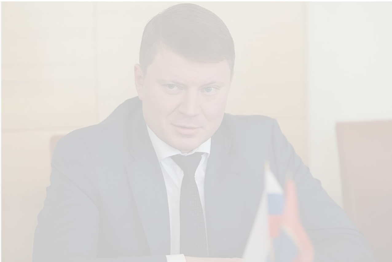
Мэрия Красноярска и «коронакризис»: жизнь на широкую ногу