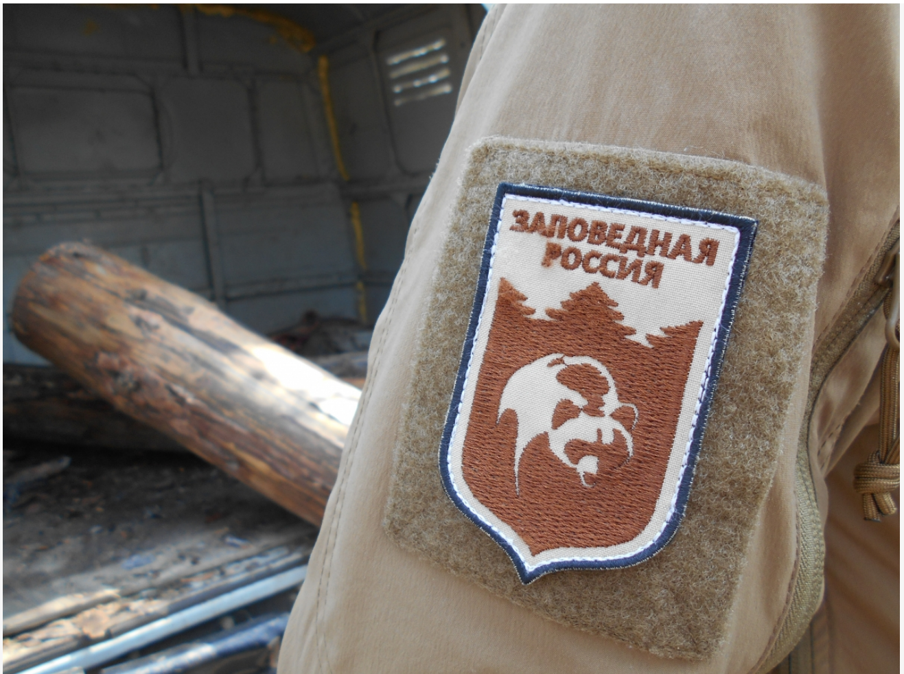
Автор: Инга Гаврикова Фото из альбома "Байкал. Прибайкальский национальный парк" © Фотобанк "RuBabr"

Автор: Миша Ковальски © Babr24.com ЭКОЛОГИЯ, ТУРИЗМ, ИРКУТСК, БАЙКАЛ 👁 31125 24.05.2020, 11:37 📍 1638