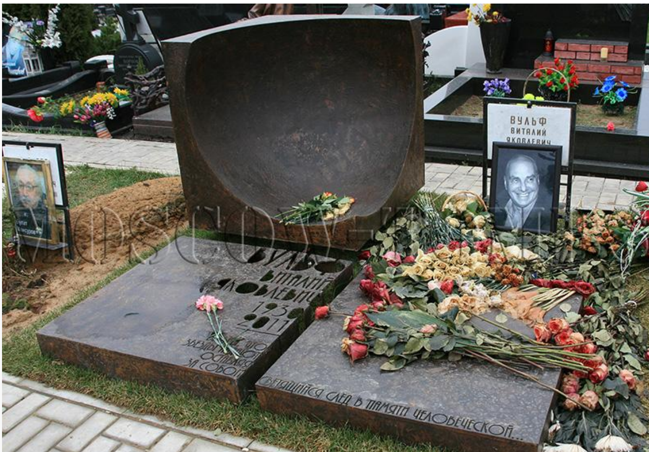
Могила Виталия Вульфа