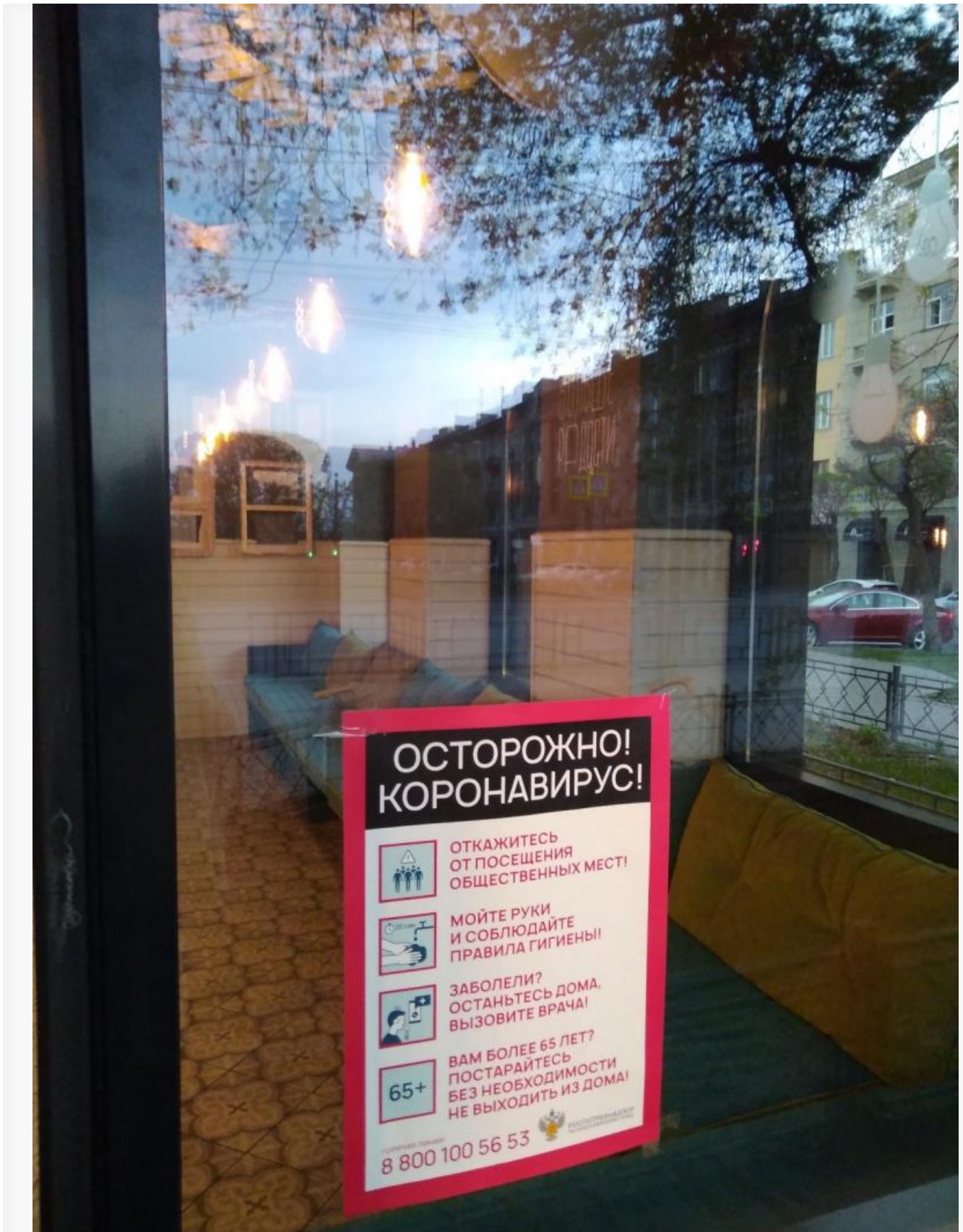
Единственное предупреждение о