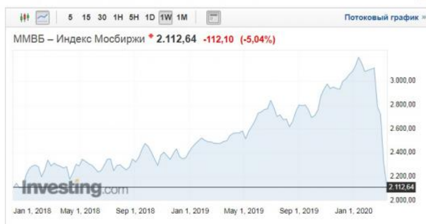
Обзор Индекс Мосбиржи

К чему готовиться? Во-первых, к резкому росту цен на все, от еды до машин и смартфонов. Во-вторых, к падению курса национальной валюты до совершенно «мусорного» уровня». В-третьих, к рецессии во всех сферах экономики, включая бюджеты и ВРП субъектов РФ. В-четвертых, к новому витку снижения реальных доходов, росту бедности, инфляции зарплат и социальных выплат.