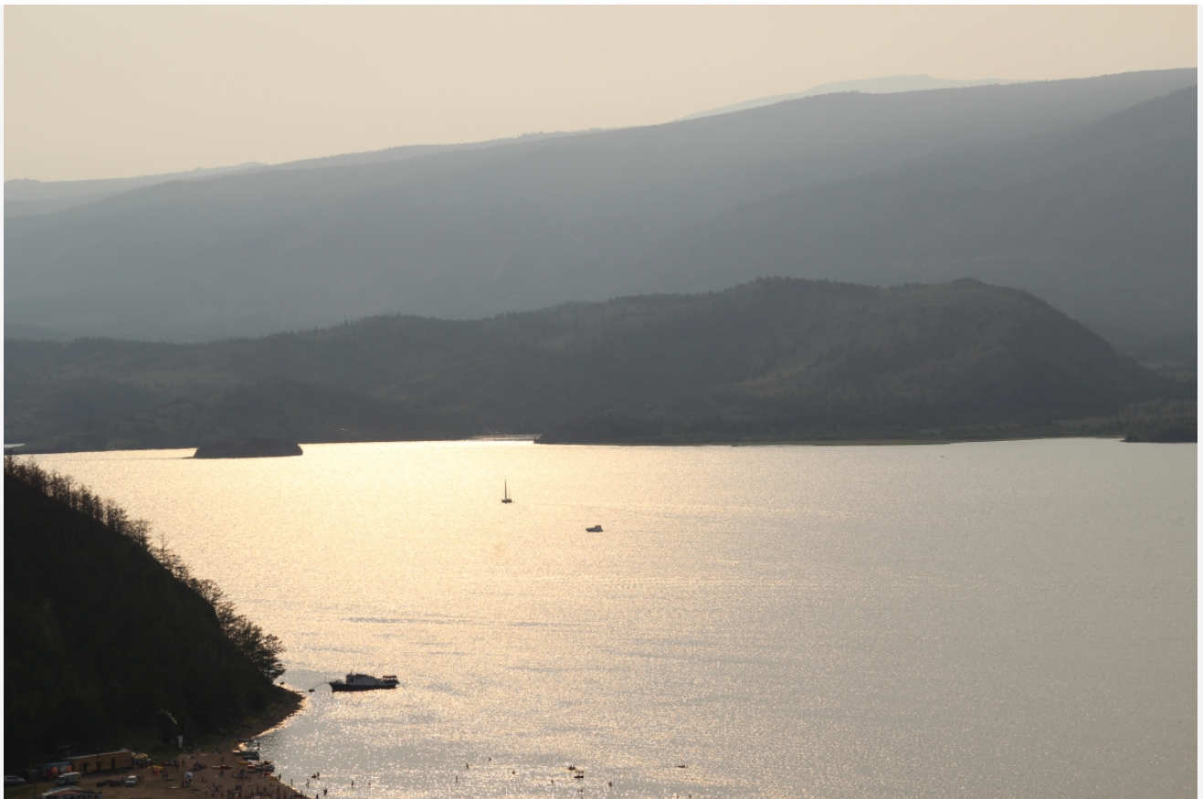
Автор: Даниил Тетерин Фото из альбома "Малое море. Виды. Лето" © Фотобанк "RuBabr"

К участию в конкурсе приглашаются некоммерческие организации (кроме религиозных и политических), государственные федеральные, региональные и муниципальные бюджетные учреждения, учреждения социальной сферы, товарищества собственников жилья, управляющие компании, индивидуальные предприниматели и юридические лица, осуществляющие деятельность в рамках конкурсных направлений.