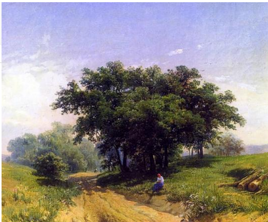
После дождя, 1869. Хранится в Третьяковской галерее