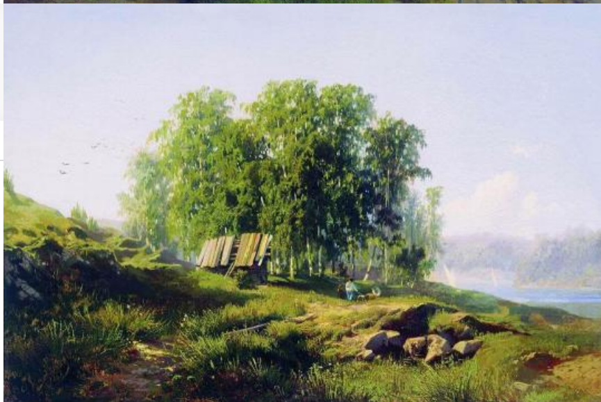
Возвращение стада, 1868. Хранится в Третьяковской галерее