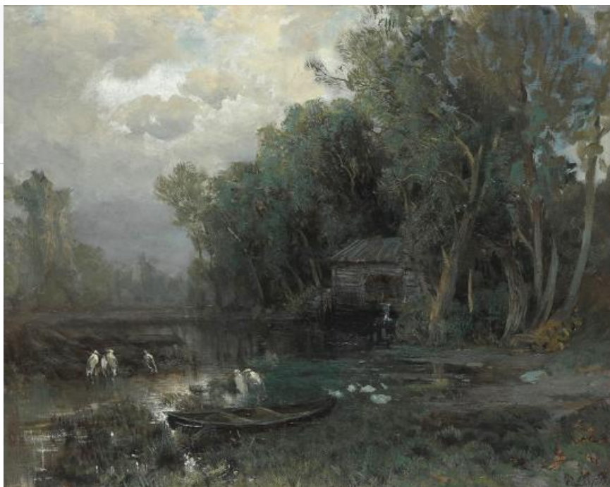
Эриклик. Фонтан (Крым), 1872. Хранится в Русском музее