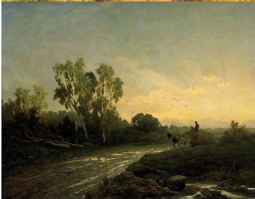
Перед дождём, 1870. Хранится в Третьяковской галерее