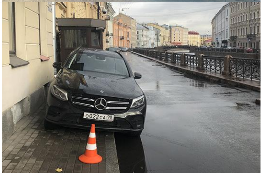
Фото: vk.com, телеграмм-канал «Мегаполис онлайн», fontanka.ru, avto-nomer.ru

Автор: Филипп Марков © Babr24.com КУЛЬТУРА, СКАНДАЛЫ, РОССИЯ 👁 63268 14.02.2020, 21:40 🔄 2007 URL: https://babr24.com/?ADE=197553