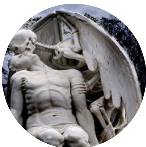
Автор текста: Максим Бакулев , политический обозреватель.

Связаться с редакцией Бабра в Иркутской области: irkbabr24@gmail.com