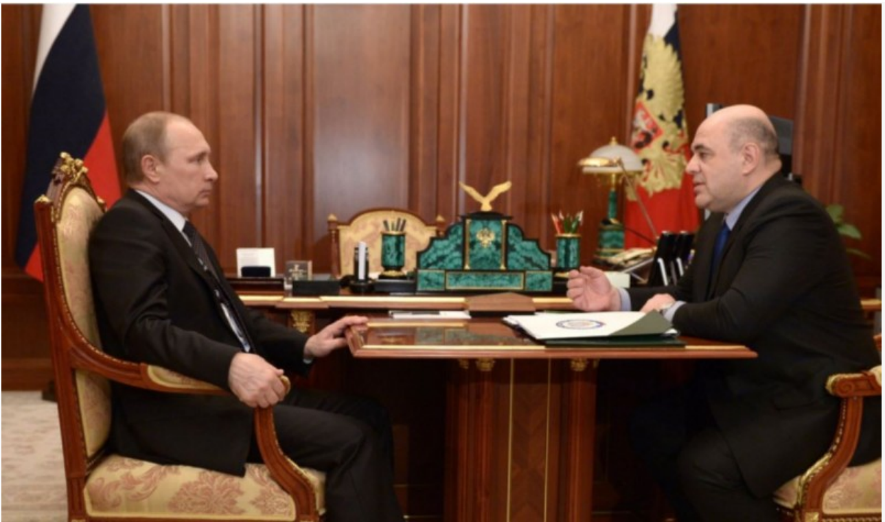
Путин Владимир, Мишустин Михаил

Вероятно, секрет в том, что Мишустин является именно тем профессионалом, которых не хватает в российском правительстве. Он не выходец из спецслужб, не член кооператива «Озеро», а простой в прошлом программист, дошедший до высших эшелонов власти исключительно благодаря своим способностям. Есть надежда на то, что он сможет оказаться тем самым «спасательным кругом», который хотя бы поддержит страну на плаву.