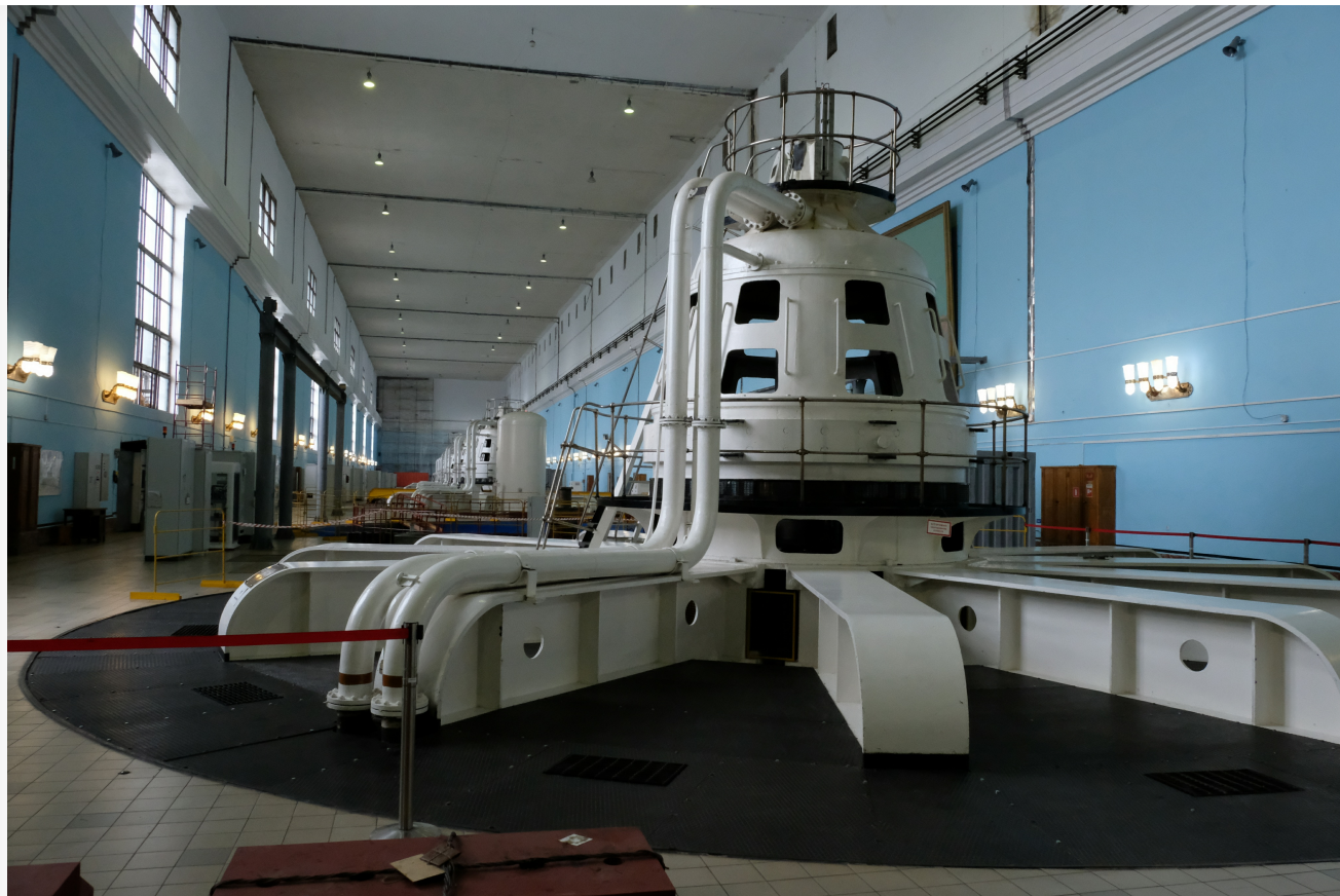
Автор: Алёна Штерн Фото из альбома "Иркутская ГЭС" © Фотобанк "RuBabr"

Даже компании с государственным участием не получают крупных капиталовложений со стороны федеральных структур. Коммунальная инфраструктура городов строилась полвека назад и ко времени современной России уже признаётся ветхой, а значит, создаются риски аварий, которые несут за собой нарушение жизнеобеспечения городов. У государства ресурсов на содержание и тем более модернизацию станций и городских сетей нет.