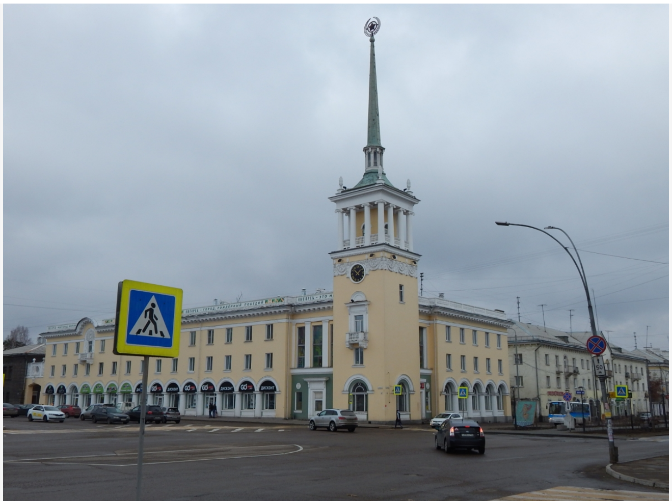
Фото из альбома "Ангарск. Виды. Лето"