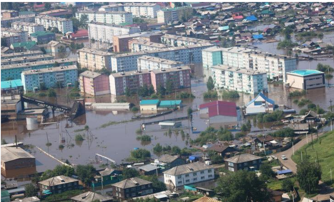
"Иркутская область. Тулун. Паводок в июне 2019 года"

В поселке Привольное Нижнеудинского района жителю дали 20 минут на обдумывание, что ему взять сертификат на жилье или выплату на капремонт. Обещали, что деньги на капремонт придут 19 октября. На момент проведения мониторинга средства еще перечислены не были.