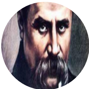
Автор текста: Антон Херсонцев , журналист.

Связаться с редакцией Бабра в Иркутской области: irkbabr24@gmail.com