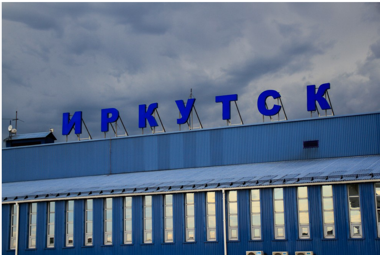
Автор: Кирилл Шипицин Фото из альбома "Иркутск. Аэропорт" © Фотобанк "RuBabr"

Автор: Анастасия Егорова © Babr24 ТРАНСПОРТ, ИРКУТСК 👁 10862 11.09.2019, 17:19