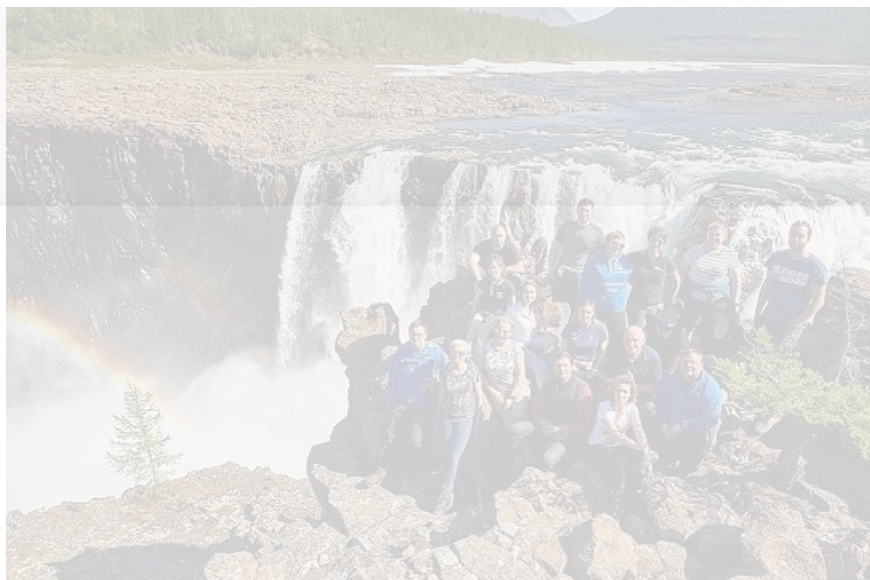
Фото на память от «Норникеля» – участники инфо-тура на водопадах плато Путорана

В качестве доказательства своей полезности они устроили междусобойчик по подписанию декларативных соглашений о сотрудничестве. Первое – между агентством развития Норильска и туристско-информационным центром Красноярского края. Второе – между Таймырским информационным центром и туристско-