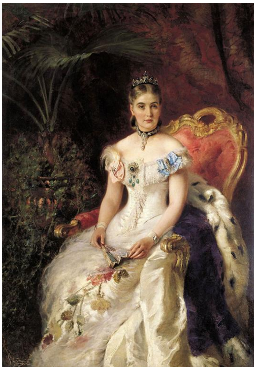
Под венец, 1884. Хранится в Серпуховском художественно- историческом музее