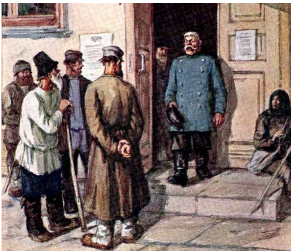
Рисунок: Соломон Боим

В случае с Петровым о месяце ареста можно будет только мечтать, но то, что Петров по настоящему жалок и смешон в своём рвении охранять режим на свой унтер-офицерский манер, уже видно даже стороннему наблюдателю.