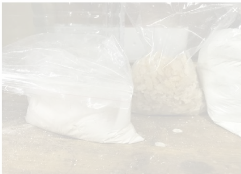
Изображение 2 из 9

Иван рассказал, что он 20-30 минут просидел в машине полиции, когда они приехали к его квартире для обыска. Ключи у него изъяли заранее.