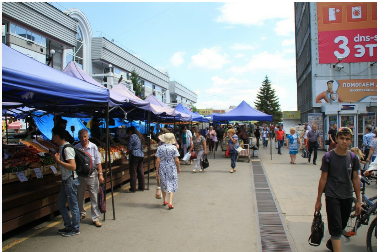
Фото из альбома "Иркутск. Центральный рынок"