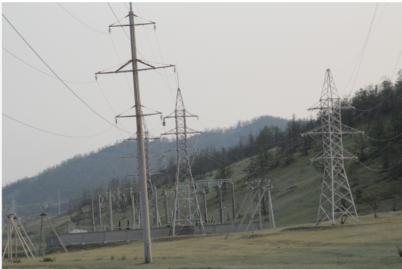
Фото из альбома "Линии электропередач" © Фотобанк "RuBabr"

Автор: Лера Крышкина © Babr24 ЭКОНОМИКА И БИЗНЕС, ИРКУТСК 👁 12824 29.04.2019, 13:54 🔄 1074 URL: https://babr24.com/?ADE=188333 Bytes: 1948 / 1693 Версия для печати