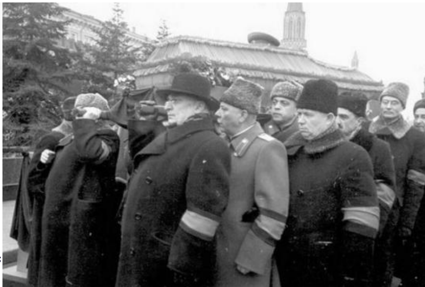
Берия, Ворошилов и Хрущёв несут гроб Сталина. 1953 год.

Вероятность того, что Генеральным секретарем ЦК КПСС станет Лаврентий Берия, была очень высока. Сам Берия, однако, упустил из виду интриганские способности Хрущёва. К июню 1953 года Хрущёв так запугал членов ЦК КПСС, что они практически единогласно проголосовали за смещение Берии. На сторону ЦК встал маршал Жуков с группой генералов, обоснованно опасавшихся потери своего влияния в случае прихода Берии к власти.