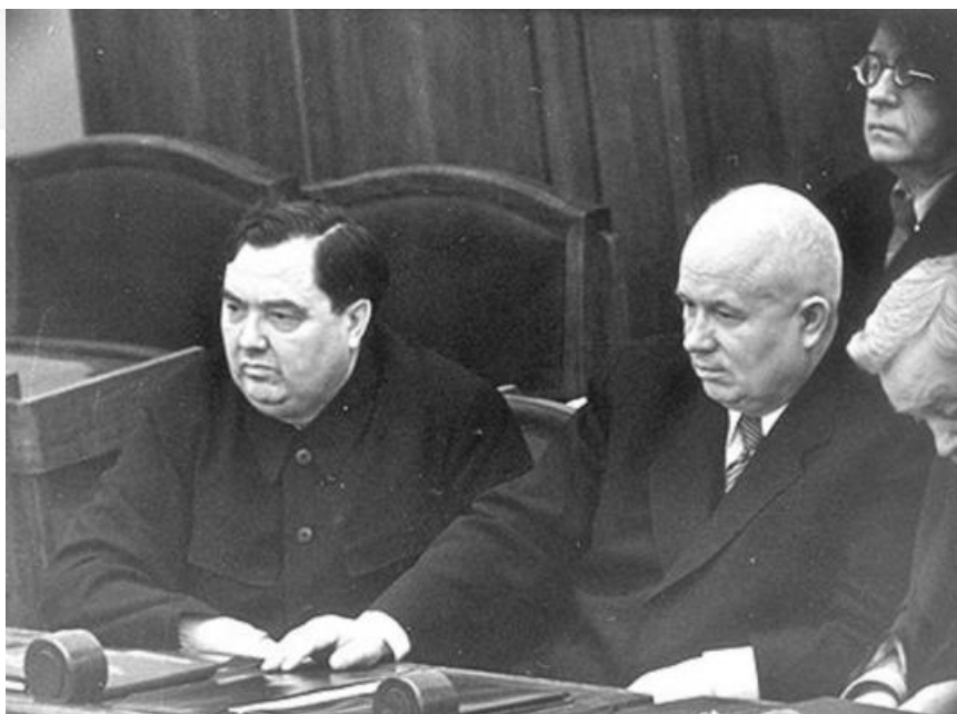
Маленков и Хрущёв. 1954 год.

В 1954 году Хрущёв продавил через Верховный Совет решение о передаче Крыма в состав Украинской ССР. Это решение имело далеко идущие политические последствия. В 2014 году Крым был с большим скандалом и последовавшими международными санкциями возвращен в состав России.