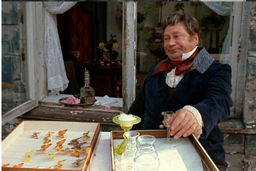
Лейброк в фильме «Прощание с Петербургом», 1971 год