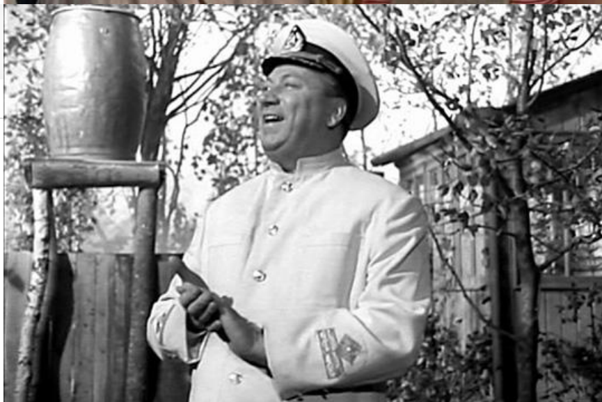
Фёдор Михайлович Дребеднёв в фильме «Черёмушки», 1962 год