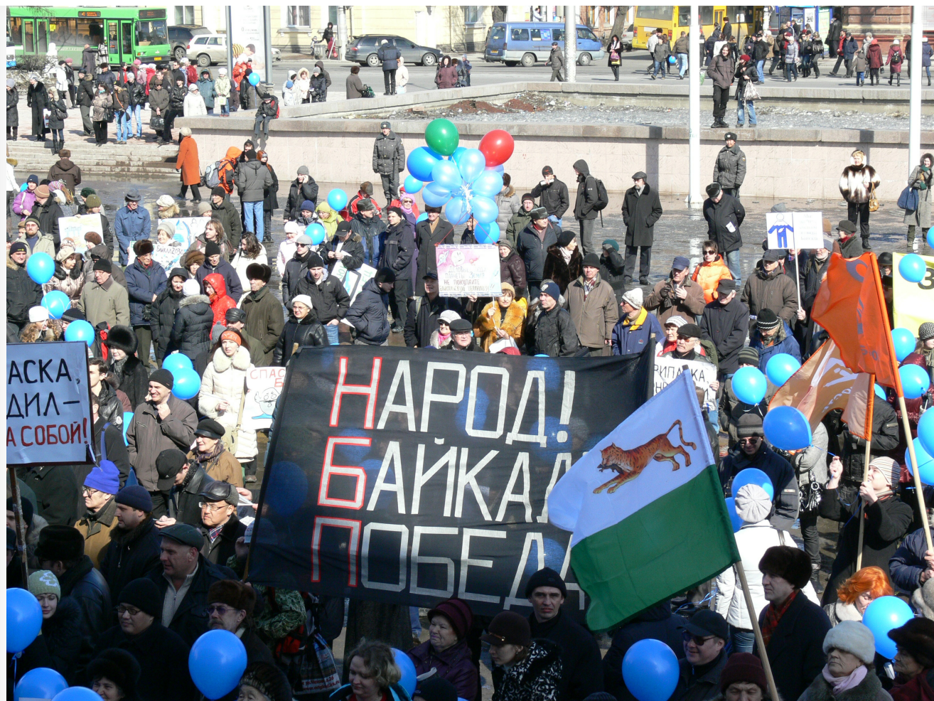
Фото из альбома "Иркутск. Экологический митинг. 20 марта 2010 года."