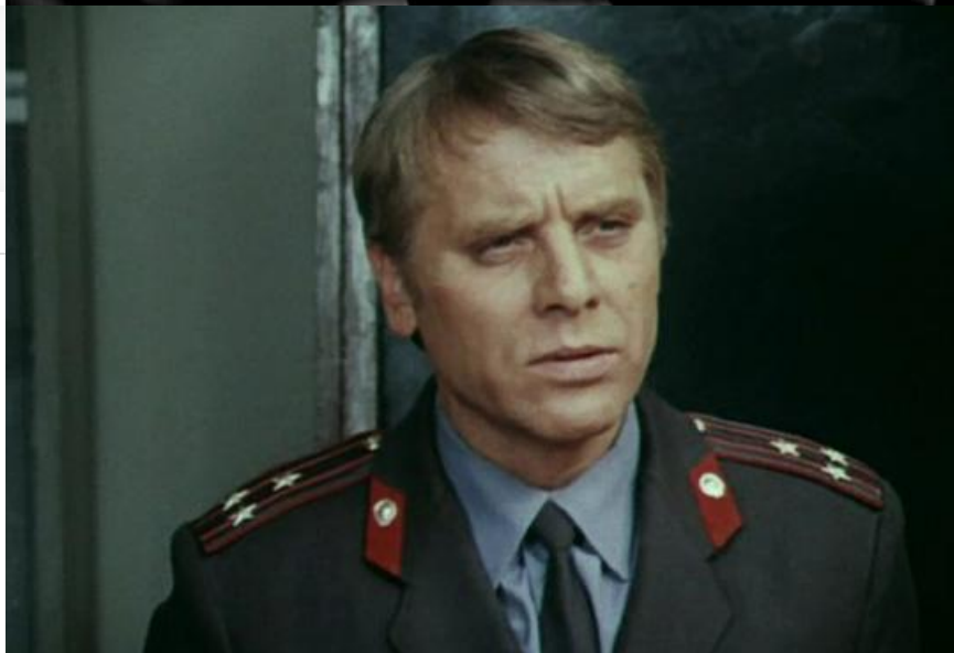
Илья Королёв в фильме «По данным уголовного розыска...», 1979 год