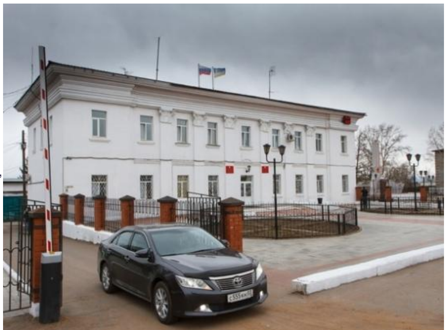
График проведения слушаний с указанием ответственных лиц за их проведение в сельских поселениях был доведен до глав поселений 11.01.2019 г. для обнародования в установленных местах. Местными администрациями проведены необходимые организационные мероприятия. Положением о публичных слушаниях, утвержденным Решением Совета депутатов МО «Иволгинский район» от 29.11.2007 г. № 372, определено, что в итоговом документе отражаются все поступившие в письменном виде предложения, за исключением предложений, снятых (отозванных) автором.

Устные предложения, а также письменные предложения, поступившие после установленного срока их приема, могут быть включены в итоговый документ по решению комиссии. Комиссия направляет рекомендации публичных слушаний соответствующим органам и должностным лицам органов местного самоуправления для рассмотрения и обеспечивает в течение 15 дней публикацию итогового документа публичных слушаний в средствах массовой информации. Таким образом, жители района были своевременно оповещены в установленном Федеральным законом порядке о проведении публичных слушаний.