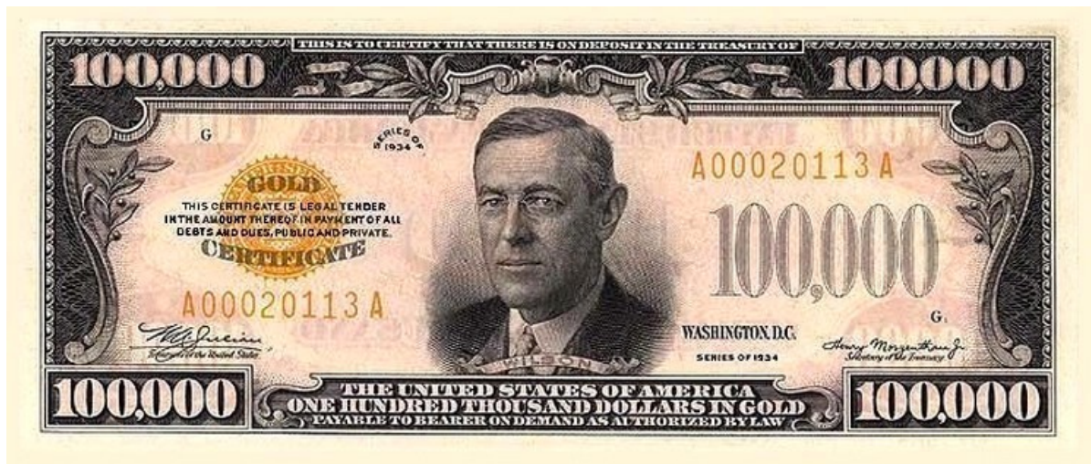
Самая крупная банкнота СССР - 1 миллиард рублей Закавказской Социалистической Федеративной Советской Республики в 1924 году.