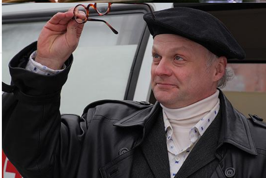
Архип Бирюков в фильме «Крик совы», 2013 год