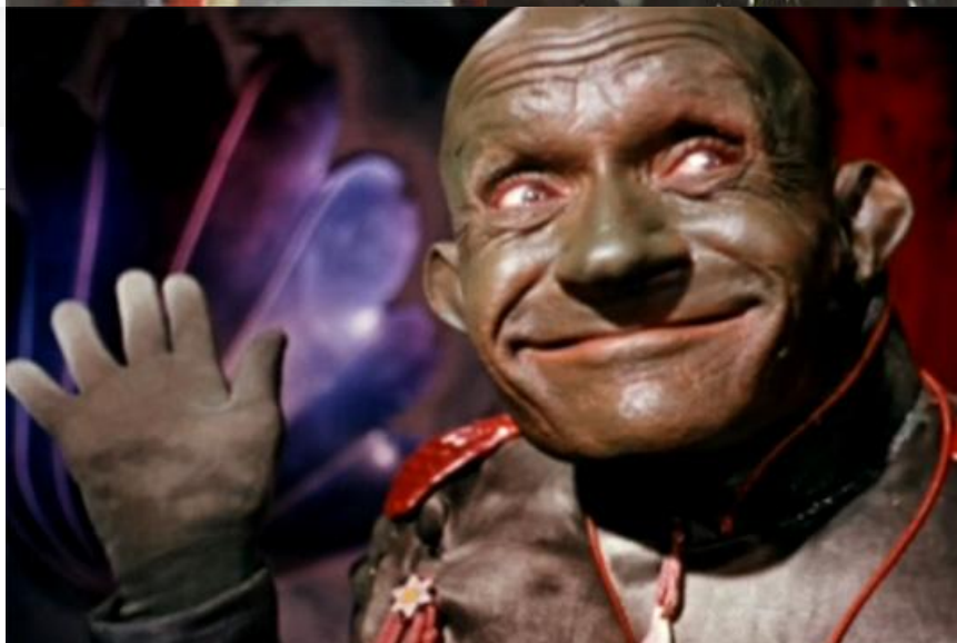
Чёрт / сплетница. Фильм «Вечера на хуторе близ Диканьки», 1961 год