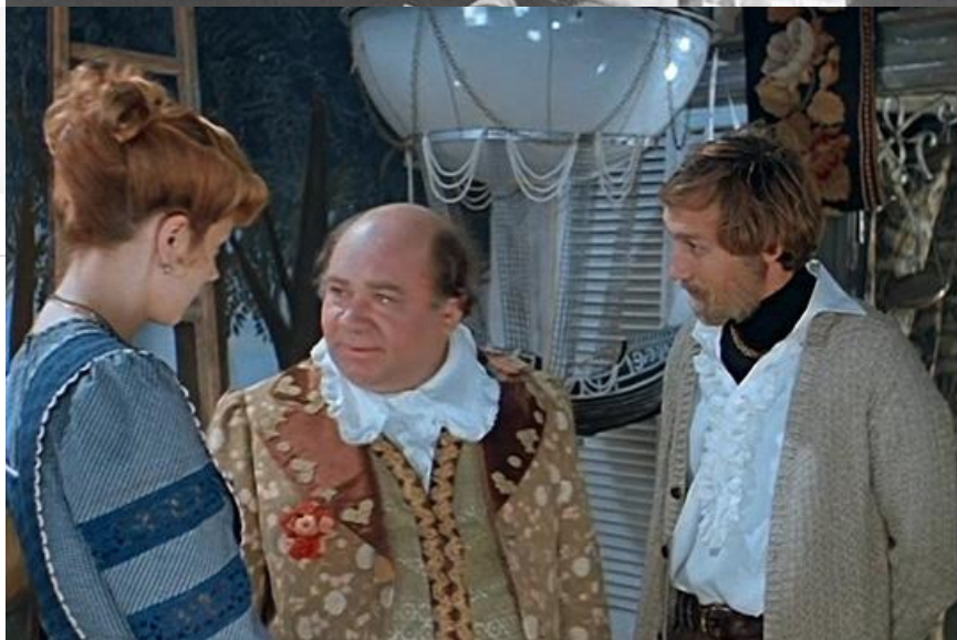
На съёмках фильма «Тот самый Мюнхгаузен», 1979 год