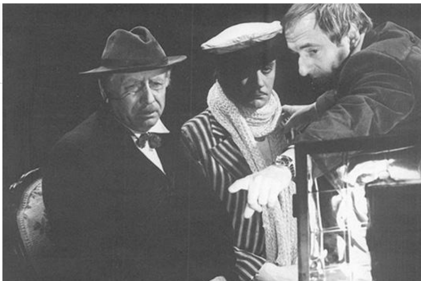
Кадр из фильма «Обыкновенное чудо». Режиссёр Марк Захаров, 1978 год