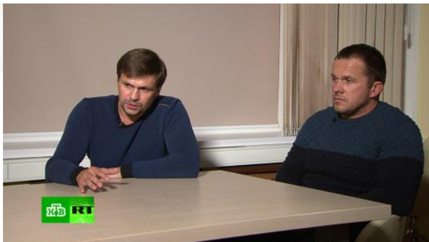
Руслан Боширов и Александр Петров из интервью с Симоньян

Таким образом, вырисовывается вполне внятная картина: участник чеченской войны и врач едут на спецзадание в Солсбери с флакончиком «Новичка». Один отвечает за тактическую сторону операции, второй - за медико-врачебный аспект. В итоге профессиональные навыки обоих привели к громкому дипломатическому скандалу.