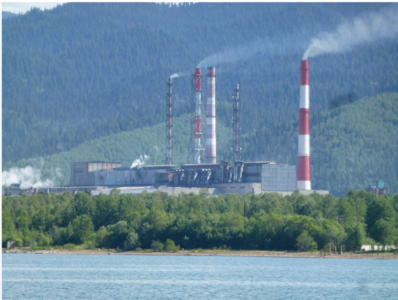
Фотограф: Дмитрий Таевский © Фотобанк Бабра

Автор: Василий Чайкин © Babr24 Источник: https://t.me/boilerroomchannel ЭКОНОМИКА И БИЗНЕС, ЭКОЛОГИЯ, РАССЛЕДОВАНИЯ, ИРКУТСК, БАЙКАЛ 👁 23320 19.09.2018, 15:42