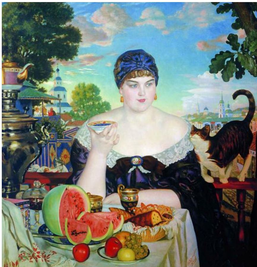
Троицын день, 1920 год. Хранится в Саратовском художественном музее им. А. Н. Радищева