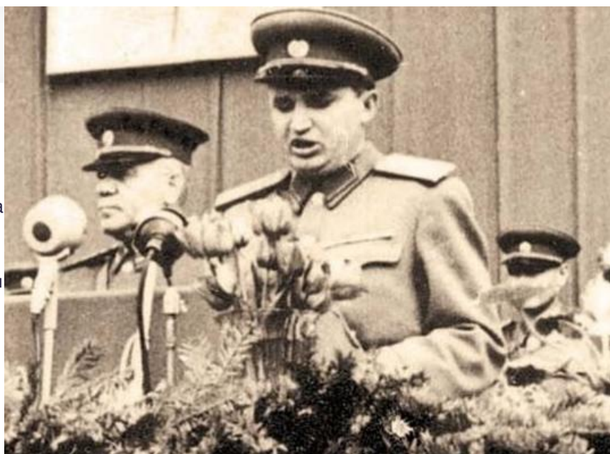
Генерал Чаушеску на трибуне.

В 1948 году тридцатилетний Николае Чаушеску получил первый в своей жизни реальный пост – министра сельского хозяйства. Перед ним была поставлена задача принудительной коллективизации фермерской Румынии. Тут характер Чаушеску был продемонстрирован во всей красе. Взяв пример с советских товарищей, Чаушеску развернул массовые репрессии против недовольных крестьян, в том числе аресты и расстрелы.