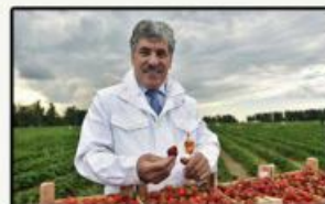
«10 шагов к достойной жизни»