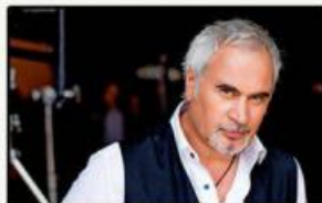
«100 шагов назад»