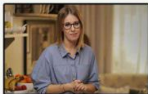
«123 трудных шага»