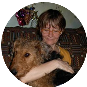
Автор текста: Анна Машерова , редактор.

На сайте опубликовано 114 текстов этого автора.