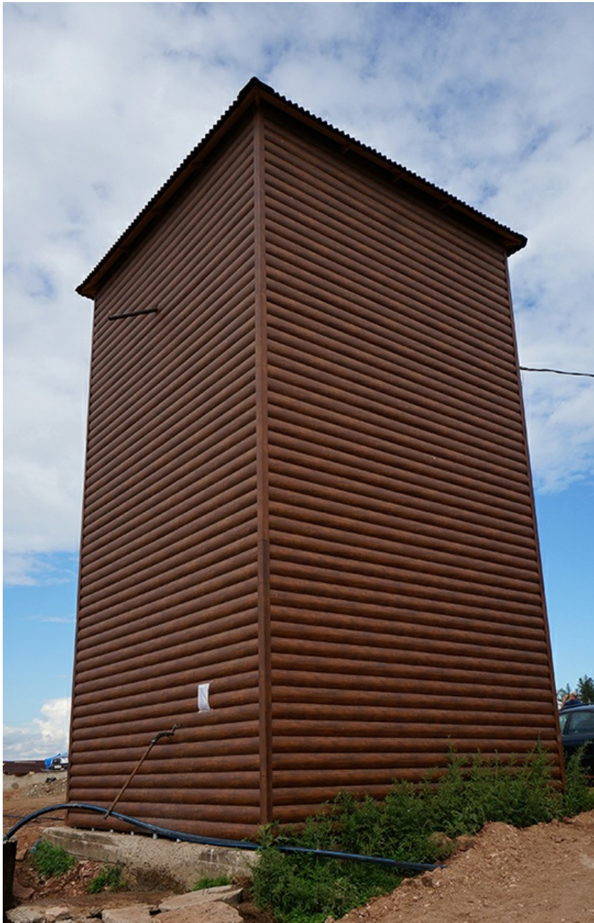
Водокачка - единственный источник воды. От нее на стройку ведет единственная пластиковая труба. О каких инженерных коммуникациях был щебет - никто не в курсе.