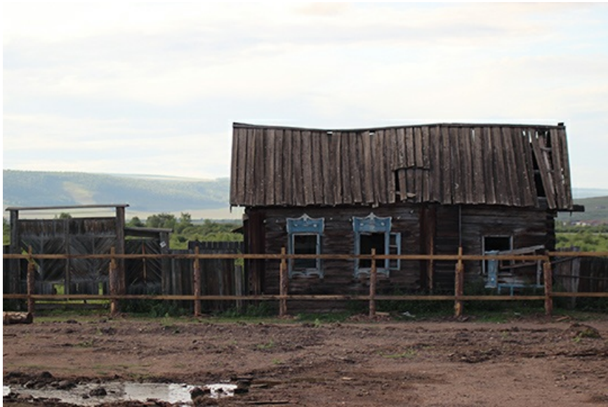
Старые домики, по всем признакам, закроют заборами. От начальственных глаз подальше.