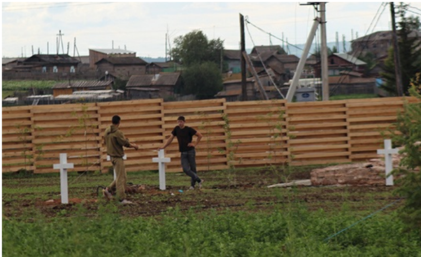
Погост - один из элементов проекта. На самом деле это как попало воткнутые бетонные кресты.