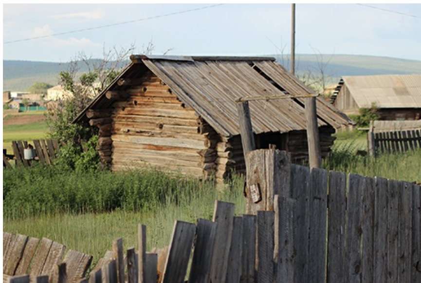
Типичная для Анги постройка. Между прочим, начало XX века.

Естественно, что выдуманный на пустом месте "юбилей" вполне удался бы, если бы губернатором Иркутской области остался Сергей Ерощенко . Схема подобных "юбилеев" с грандиозным пиар-сопровождением и не менее грандиозным распилом бюджетных денег была отработана еще на придуманном "тысячелетии Казани" в 2005 году. Но - губернатор сменился на коммуниста, политическая диспозиция изменилась, и интерес федерального Минкульта к процессу пропал.