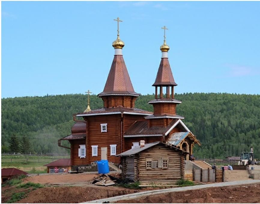
"Дом миссионера" на фоне церкви смотрится убого и мрачно.