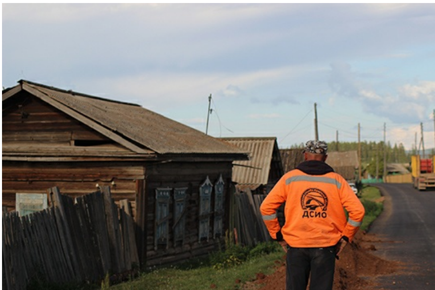
Дорожная служба Иркутской области неплохо заработала на проекте. Рука руку моет.