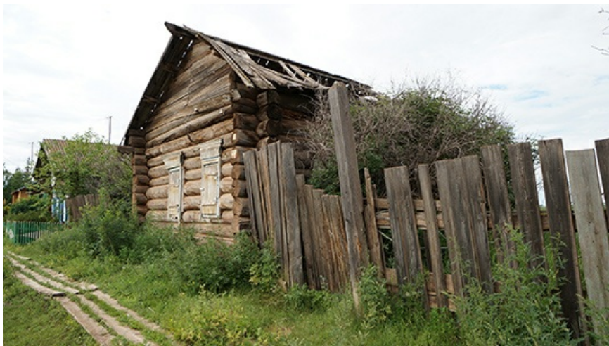
После дождя в Анге очень грязно. Спасают деревянные тротуары.