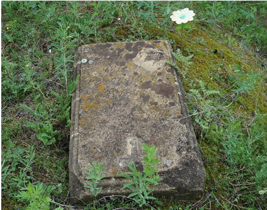
Анга - реально древнее село. На местном кладбище можно встретить надгробные камни XIX века.