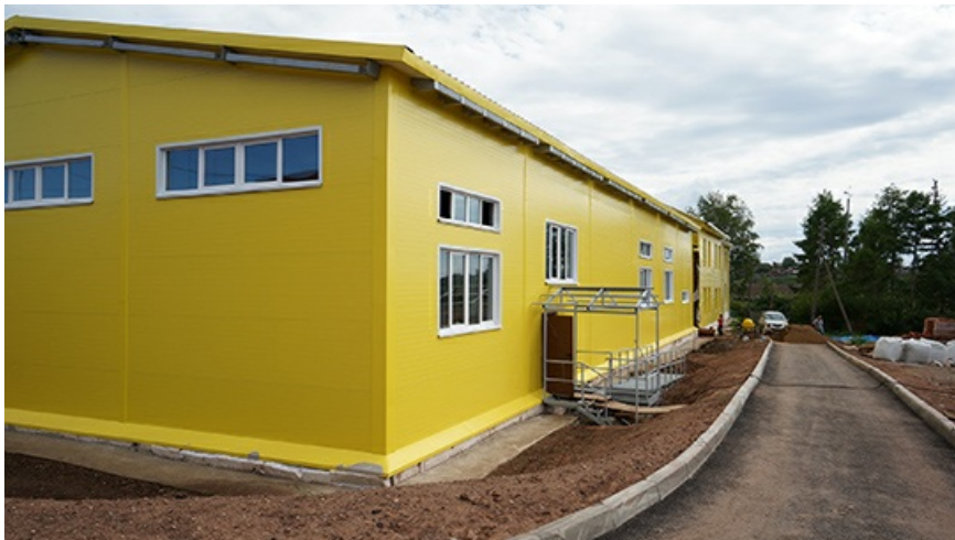
Отремонтированная школа почему-то покрыта сайдингом цвета "вырви глаз".

Кроме того, проект предусматривает ремонт местной школы и строительство спортзала для нее. Какое отношение школа имеет к святителю Иннокентию, непонятно, но это, наверное, единственные реально нужные затраты в проекте.