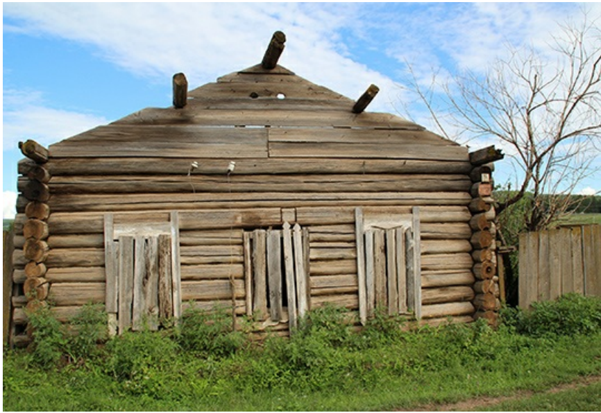
Ангинский архитектурный шедевр.

Первоначальный проект предполагал затраты в сумме 113 миллионов рублей . Однако, ввиду потери федерального финансирования, их пришлось существенно сократить. Вместо клееного бруса, имитирующего старинные стены, пришлось использовать газобетон и базальтовый утеплитель. Основные расходы легли на региональный бюджет. Иркутская епархия РПЦ, которая изначально высказывала пожелания участвовать в проекте, пока отделяется благословениями. По последним данным, в кассе епархии лежит около пяти миллионов рублей на проект в Анге, но будут ли даже эти гроши выложены на бочку, пока неизвестно.