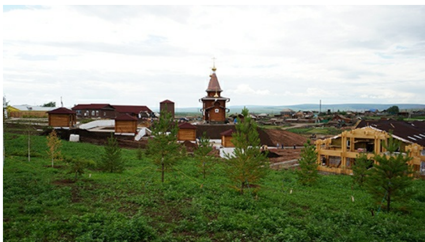
Вид на строительство издалека выглядит даже прилично.