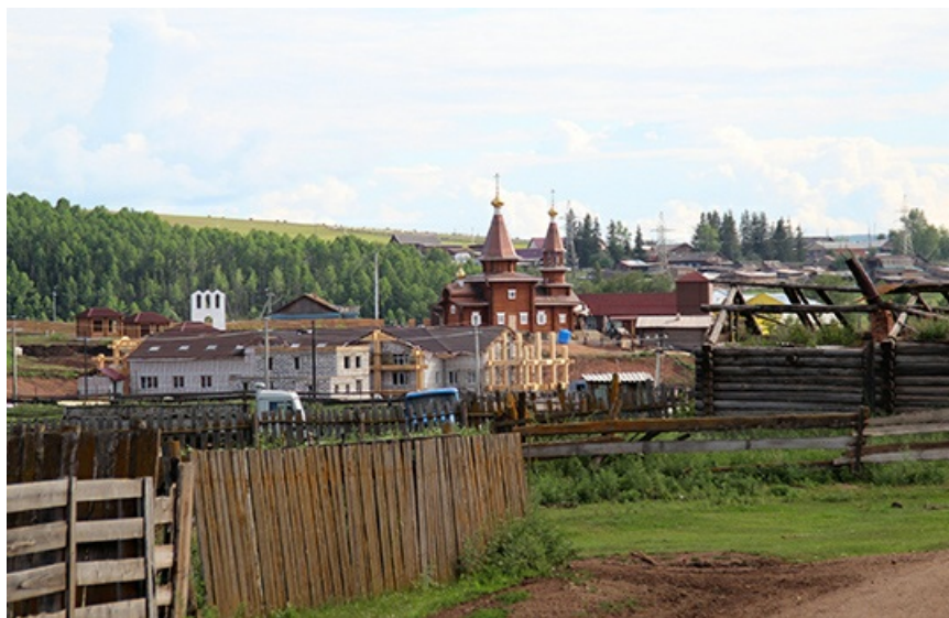
Вид на культурно-просветительский центр слегка омрачен кривыми заборами.

Пятая - стоянка для автомобилей и инфраструктура.