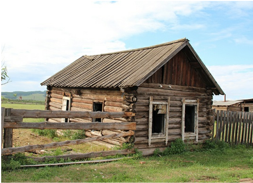
А вот такие домики встречают гостей в самой Анге.