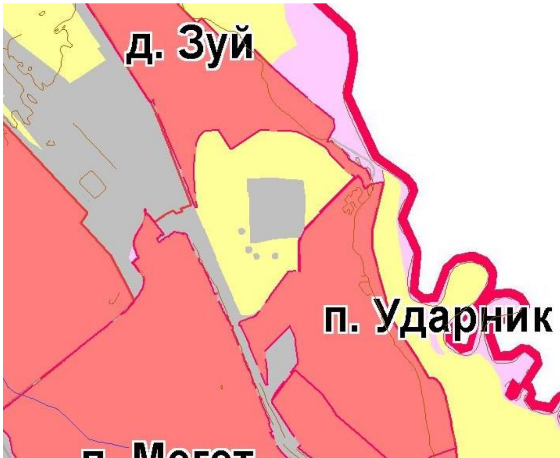
Слайд 3: Генплан с принятыми изменениями (ноябрь 2016 г.)