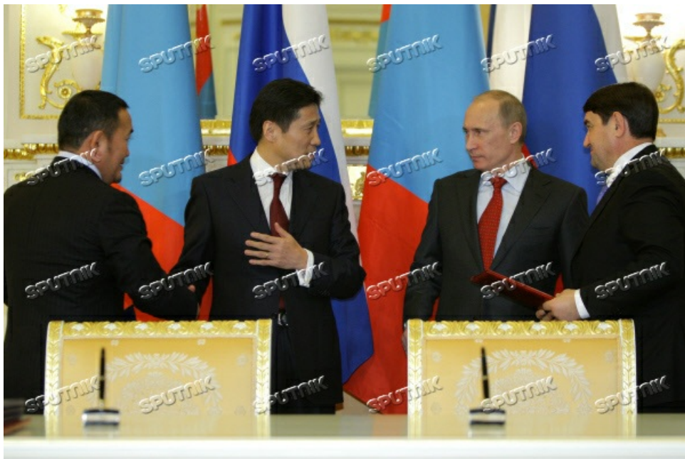
И, наконец, на третьем фото видно, как монгольский министр Баттулга жмет руку монгольскому же премьеру Батболду и, возможно, намеревается пожать руку Владимиру Путину. Но, к большому сожалению нынешнего